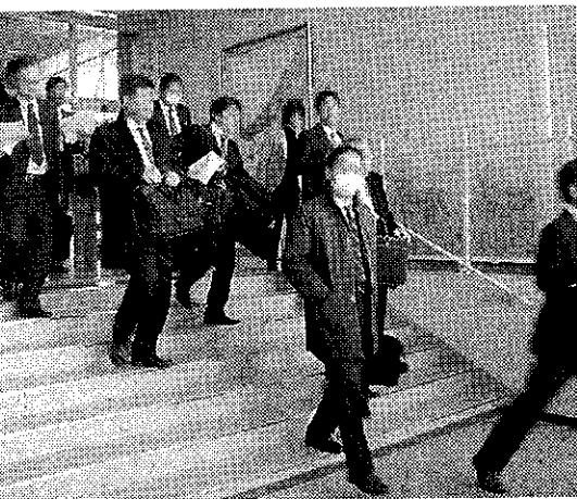
明会に参加した債権者ら(一部画像修正あり)

側が保全管理命令取り消しの根拠としているのが、これまで金融機関と準備してきたという事業再生ADR。現時点では、いずれかの裁判での決定が出ない限り、会社の今後の方向性は出ない。説明会でも、これまでの経緯や、こうした裁判の流れ、手続きなどが説明されたに過ぎない。12カ月のうちに方向性は出る見通しだが、仮に会社更生手続開始決定が出て、再建計画を立て、認めら